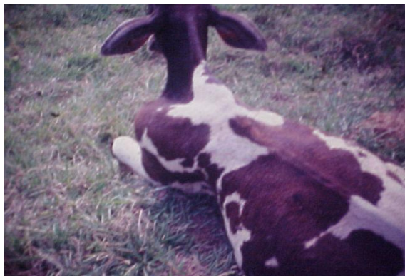
INCHAÇO NA PÁ, CARACTERÍSTICA DA DOENÇA EM BOVINOS.