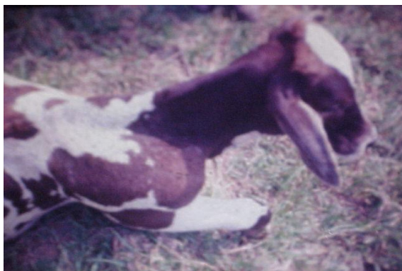
O ANIMAL MORRE DE 2 A 3 DIAS APÓS APARECIMENTO DA DOENÇA

Lembre-se que o inchaço pode aparecer ou não. Ao notar animais com febre alta, falta de apetite e pelos arrepiados procure um Médico-Veterinário para diagnosticar a doença.